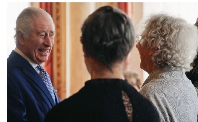
En décembre 2023, lors d'une rencontre privée à Buckingham Palace, Sa Majesté le roi Charles III s'adresse avec chaleur à deux Coronation Girls canadiennes, ravivant avec elles les souvenirs du couronnement de la reine Élisabeth II.

À l'été 2023, le réalisateur Douglas Arrowsmith a soumis une proposition détaillée au palais de Buckingham. Après plusieurs rencontres, un accord fut conclu pour filmer une scène finale au palais, en présence d'une douzaine de ces