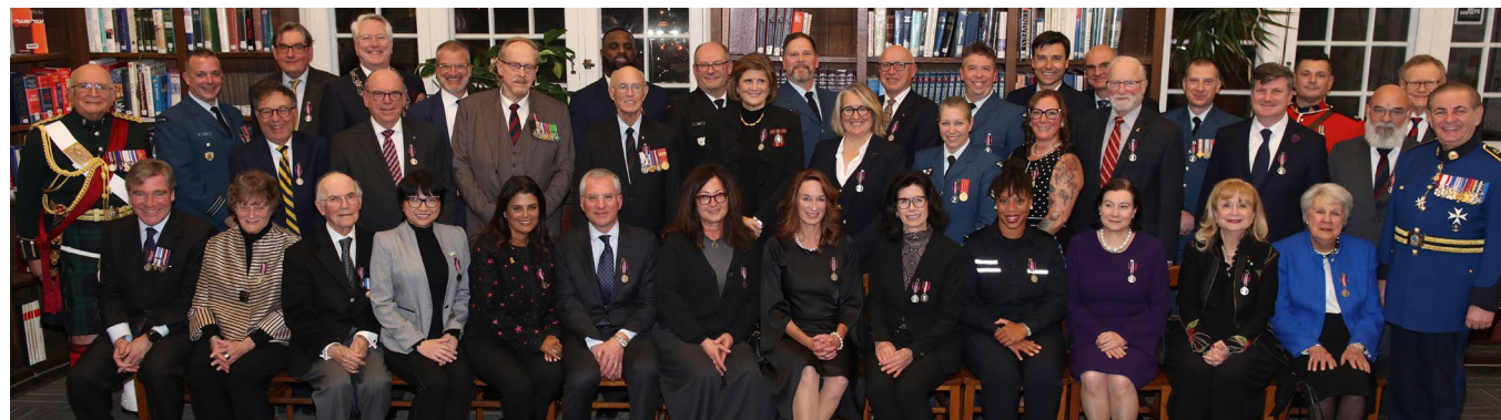
Les récipiendaires de la cérémonie tenue le 18 janvier 2025 à la bibliothèque Atwater de Westmount, présidée par le lieutenant-colonel honoraire Bruce Bolton.

Note: Ces 33 cérémonies protocolaires ont été tenues aux quatre coins du Québec. À travers ces événements empreints de dignité, la reconnaissance s'est incarnée dans des gestes concrets et porteurs de gratitude.