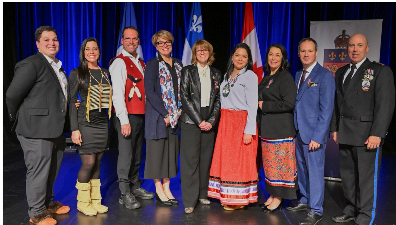
Quelques récipiendaires ont souhaité immortaliser l'instant aux côtés de l'honorable Manon Jeannotte, lors de la cérémonie du 12 décembre 2024 au Cégep Garneau de Québec.