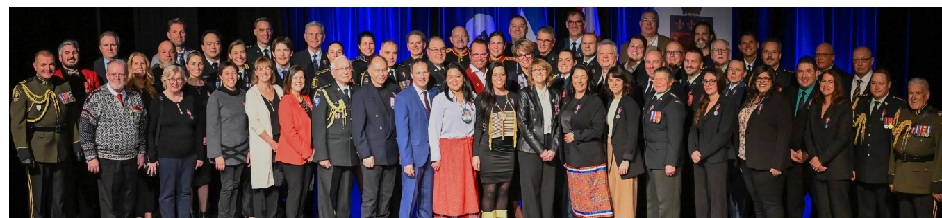
À Québec, le 12 décembre 2025, une cérémonie de remise de médailles s'est tenue au Cégep Garneau, rassemblant 57 récipiendaires.