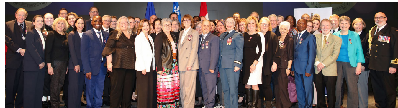
Les récipiendaires et les membres du cabinet lors de la cérémonie tenue le 18 janvier 2025 à l'Université du Québec en Outaouais, Gatineau

Enfin, plusieurs éclaireurs et membres du comité ont eux aussi exprimé leur fierté de participer à cette aventure. Certains ont affirmé qu'il s'agissait de l'expérience la plus riche de leur vie professionnelle ou bénévole. Observer les effets concrets du programme, dans les regards, les paroles et parfois même les silences, leur a permis de mesurer le pouvoir d'une reconnaissance authentique. À leurs yeux, ce programme n'a pas seulement honoré des personnes : il a rapproché les cœurs.