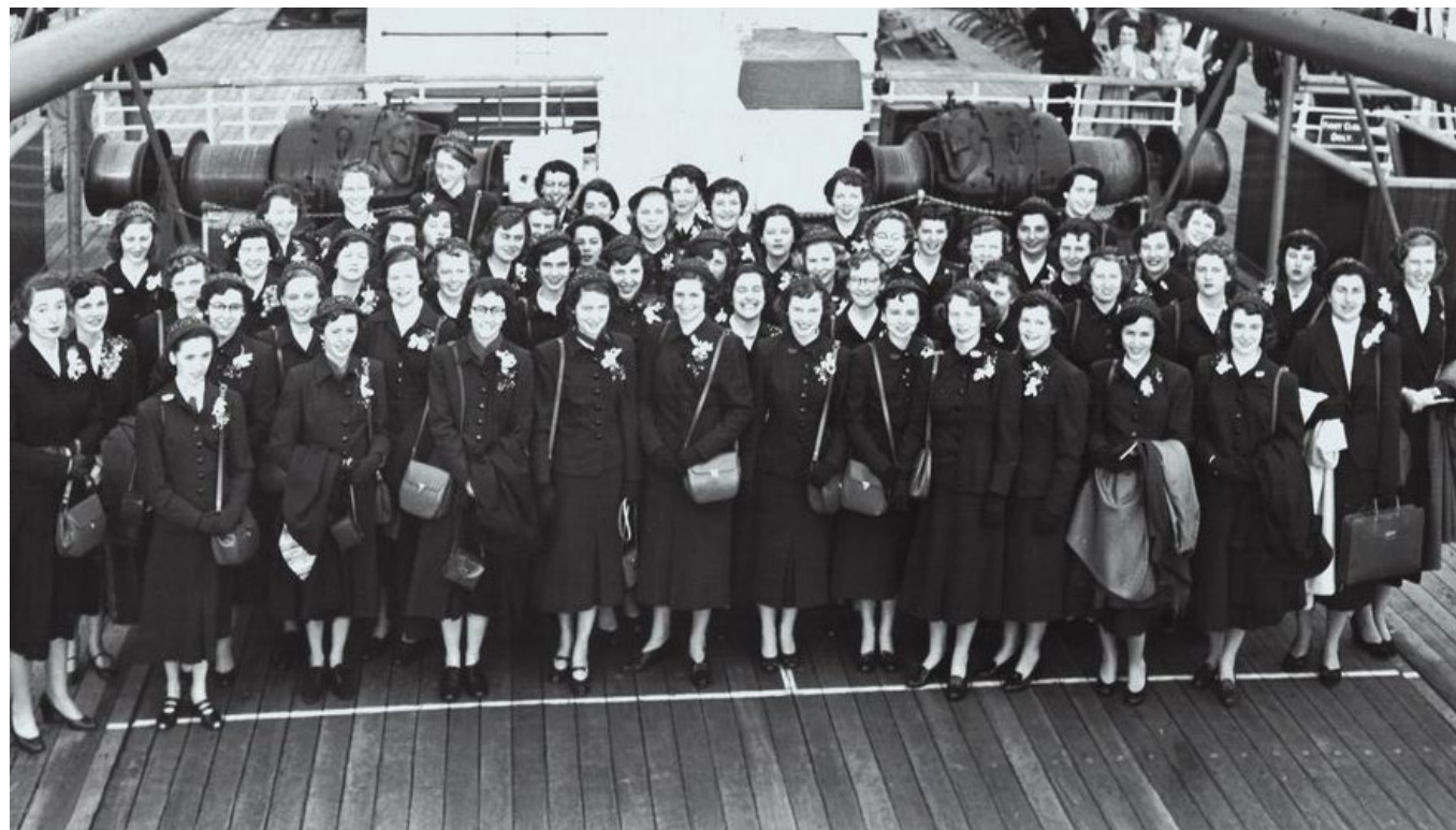
À bord de l' Empress of France , les 50 Coronation Girls canadiennes s'apprêtent à traverser l'Atlantique pour rejoindre l'Angleterre et prendre part aux célébrations du couronnement de la reine Élisabeth II, un voyage empreint de fierté et de solennité.