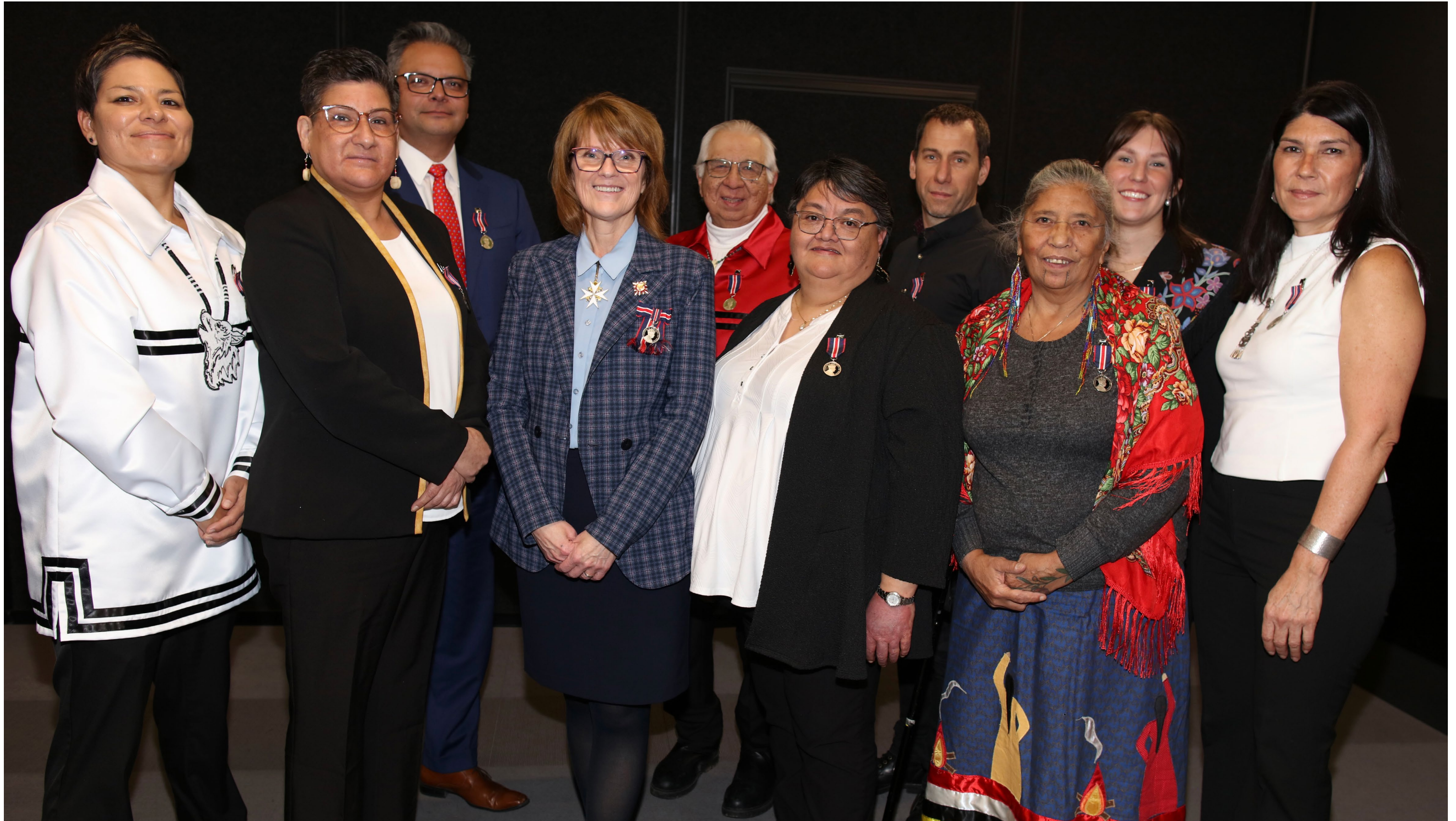
Le 18 décembre 2024, à l'Université Concordia de Montréal, lors d'une cérémonie réunissant 77 récipiendaires, des représentants de différentes Premières Nations ont souhaité poser avec l'honorable Manon Jeannotte, lieutenant-gouverneur du Québec, qui a marqué la vie publique au sein de la Nation micmaque de Gespeg comme conseillère, puis comme cheffe de 2015 à 2019.