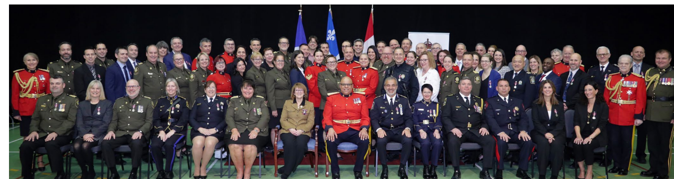
Les récipiendaires du milieu de la sécurité publique lors de la cérémonie tenue le 23 janvier 2025 au quartier général de la Division « C » de la Gendarmerie royale du Canada, Westmount